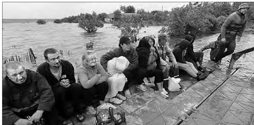
Військові облаштували поромну переправу і доставляють гуманітарну допомогу та людей на «острів».