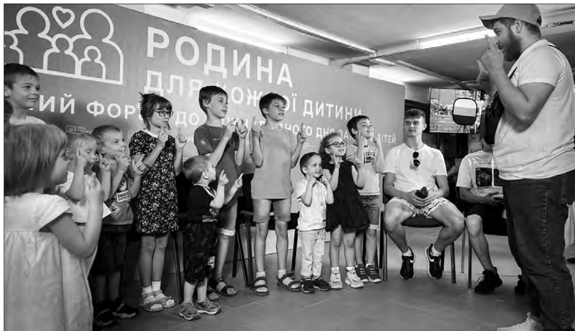
Маленькі українці, яких врятували завдяки Офісу Омбудсмена.

українського контрнаступу на кримському напрямі. По-друге, дискредитувати ЗСУ та представити Україну як «терористичну країну». В інформаційному середовищі вже поширюються проросійські наративи, ніби це Україна самостійно підірвала Каховську ГЕС. Аргументи: ГЕС контролювалася росією, найбільше шкоди вона завдала містам, підконтрольним рф».