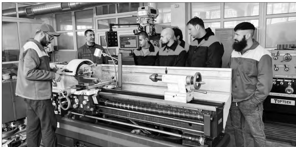
Вимушені переселенці за час перебування у Вінниці можуть опанувати спеціальності автослюсаря, токаря, плиточника-облицювальника — таку безплатну можливість їм надає Центр профтехосвіти №1.

Число людей, які зупинилися в цих стінах, зростає. Тут побувало приблизно 19 тисяч тих, хто тікав від війни. Розміщали не тільки в гуртожитку, а й у спортивній залі, начальних